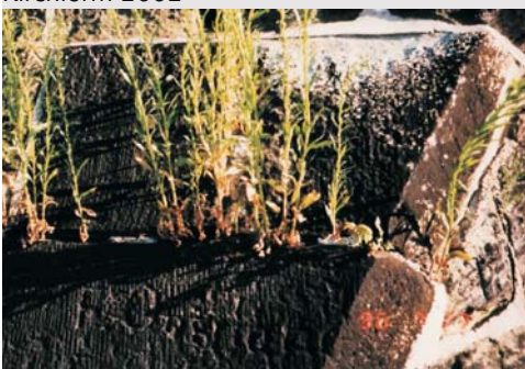
Detail Turmhaube 1996

Die kunsthistorisch bedeutsame gotische Kreuzigungsgruppe über dem Südportal konnte fachkundig restauriert werden, mit der Sanierung der Raumfassung im Kirchenschiff fanden die Restaurierungsarbeiten 2002 Ihren Abschluß.