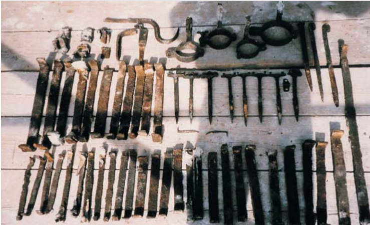
Ausgebaute Eisenklammern der Turmhaube