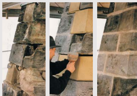
Restaurierung der Turmhaube 1998

Bauherr: Evangelische Andreaskirche Erfurt